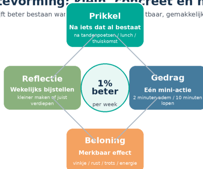
Afbeelding 5. Gewoontevorming: prikkel, gedrag, beloning en reflectie.

Een gewoonte blijft beter bestaan wanneer de prikkel concreet, herhaalbaar, gemakkelijk en belonend is.