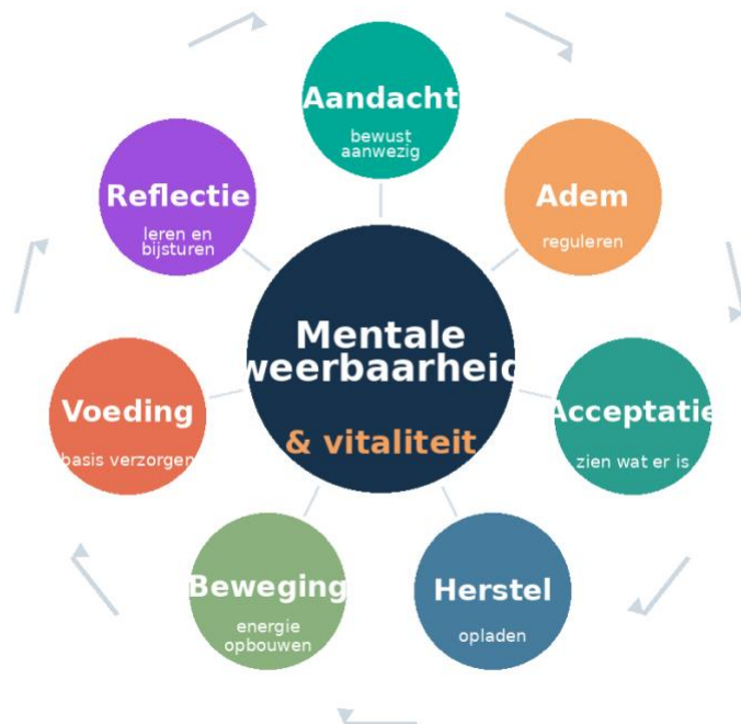
Afbeelding 1. De wisselwerking tussen mentale weerbaarheid en vitaliteit.

Mentale weerbaarheid is het vermogen om onder druk aanwezig, flexibel en handelingsbekwaam te blijven. Vitaliteit is de beschikbare fysieke en mentale energie om te functioneren, te herstellen en te groeien. Samen vormen ze een fundament voor duurzaam functioneren.