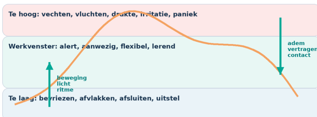
Afbeelding 3. Het werkvenster voor stressregulatie.

Mentale weerbaarheid groeit wanneer je signalen eerder herkent en terugkeert naar je optimale spanningszone.